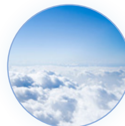
Fresco y limpio

Para el modelo Ambi Pur 3volution, podemos encontrar las siguientes fragancias: