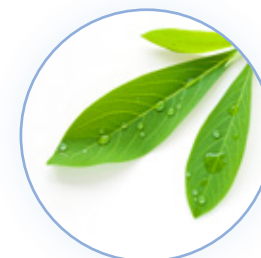
Frescor de la mañana