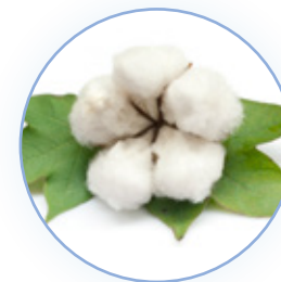
Nubes de algodón