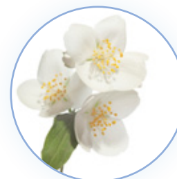
Suaves flores blancas