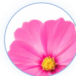
Flores y brisa

Para adaptarse a los gustos olfativos de todos los miembros del hogar, Ambi Pur Spray está disponible en los siguientes aromas: