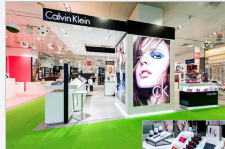
Stand de ck one color en El Corte Inglés, Portal de l'Angel, Barcelona

Por eso, en este proyecto de marketing colaborativo, el pack de inicio se recoge directamente en las tiendas ck one color de algunos centros El Corte Inglés. Los asesores en maquillaje nos aconsejarán sobre qué color es el que más nos conviene según nuestra dermis.