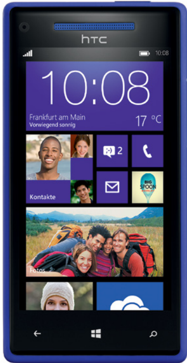
Das brillante Display reduziert Reflexion.

Wenn wir vom Design sprechen, ist auch das brillante Display eine nähere Beschreibung wert.