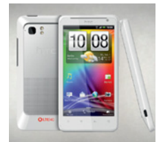
Erstes LTE 4G Handy von HTC – Velocity 4G