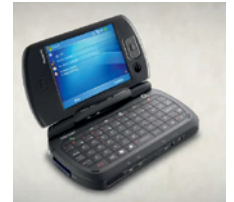
Erstes 3G Phone