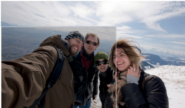
Der kleine Ausschnitt zeigt das Foto, wie es bisherige Smartphone-Kameras aufnehmen. Hier sind nur 3 Personen zu sehen. Der große Ausschnitt zeigt das Foto, das Du mit dem Windows Phone 8X by HTC machen kannst.

Damit ist es möglich, zusammen mit Dir bis zu vier Personen auf einem Foto festzuhalten. Einfach den Arm ausstrecken und mit der 88-Grad-Weitwinkel-Frontkamera das Foto schießen. Du wirst feststellen, auf dem Foto erscheinen mehr Menschen und mehr Hintergrund.