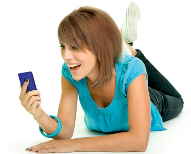
Videotelefonie mit der Weitwinkel-Frontkamera des Windows Phone 8X by HTC macht einfach Spaß.

Die Frontkamera ist aufgrund ihrer Eigenschaften auch gut für Videotelefonie mit mehreren Personen vor dem Smartphone geeignet.