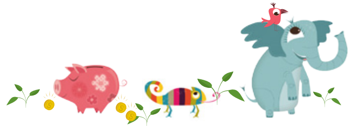
Los divertidos elementos gráficos de Menos es Más™.