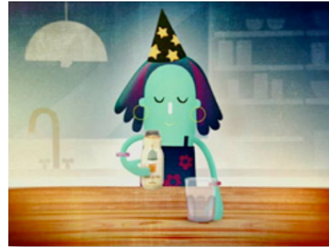
Fotograma del spot publicitario del producto.

Menos es Más™ colabora con el movimiento Somos lo que hacemos , surgido del internacional We are what we do .