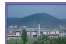
Fábrica de Besançon.