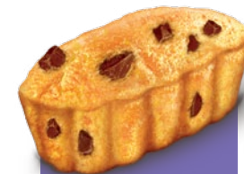
Fábrica de Jussy.

Um facto curioso, houve equipas de Jussy que tomaram um banho inesperado de chocolate Milka, quando um tubo sob pressão se soltou. Poderíamos dizer que certamente até os seus dedos terão lambido!