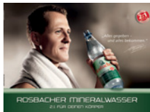
Ein Werbeplakat mit Michael Schumacher.