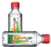
Die 0,2 Liter Flasche Rosbacher Naturell.