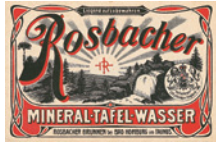
Ein Etikett aus dem Jahr 1900.