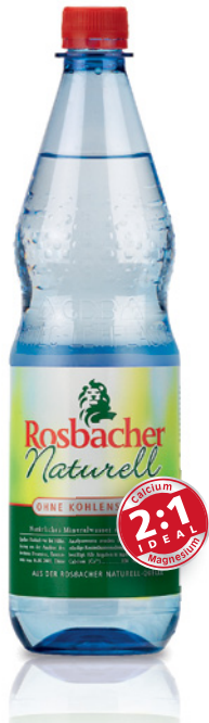
Rosbacher Naturell entspringt der Rosbacher Naturell Quelle.

Still oder sprudelig – das ist nur eine Frage des Geschmacks: Denn alle Rosbacher Mineralwässer enthalten eine hohe Mineralisierung und schmecken zugleich abgerundet, auch die kohlenstofffreie Variante.